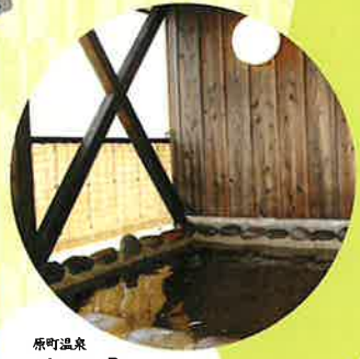
原町温泉 ゆくら妻有