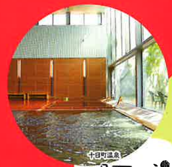
十日町温泉 明石の湯