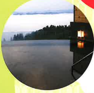
まつだい芝峠温泉 雲海