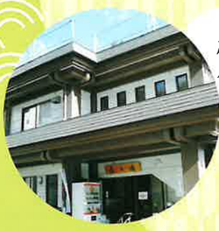
松之山温泉 鷹の湯