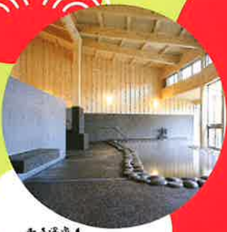
千手温泉 千年の湯