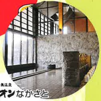
宮中島温泉 ミオンなかさと